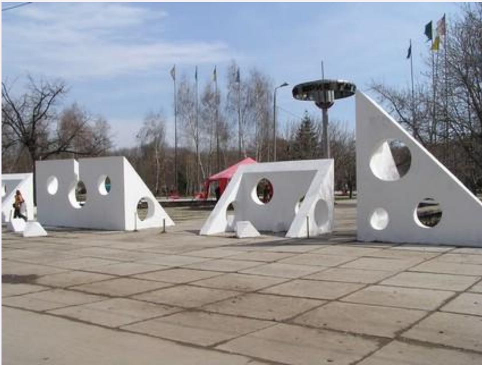
Парк им. Ю. Гагарина в Самаре