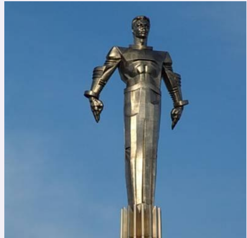
Памятник Ю. Гагарину в Москве

Во многих городах России и других стран существуют улицы, проспекты, площади, бульвары, парки, клубы и школы имени Гагарина.