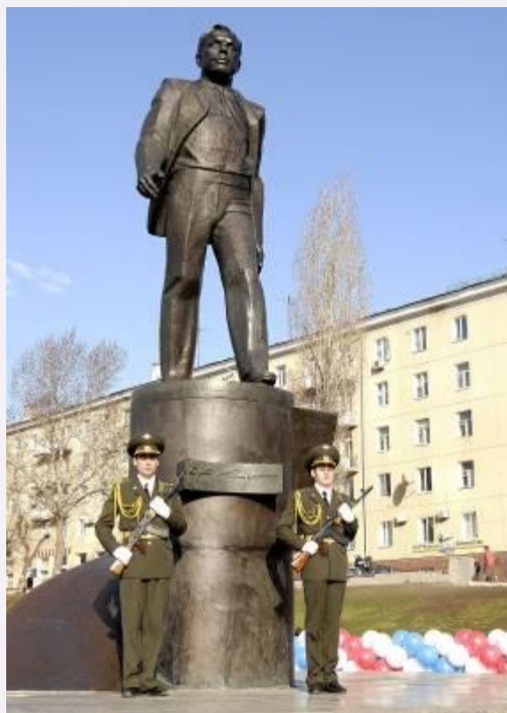
Памятник , Гагарину в Саратове на Набережной Космонавтов