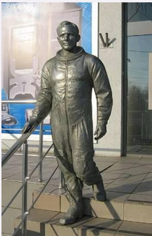
Памятник Ю. Гагарину в Харькове