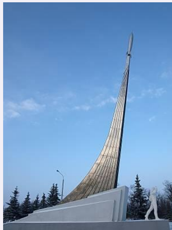
Памятник Ю. Гагарину на месте приземления возле города Энгельс в Саратовской области